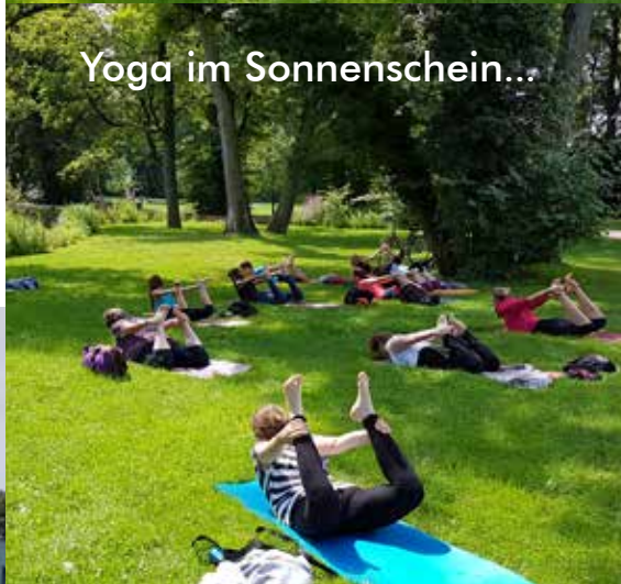
Yoga im Sonnenschein...