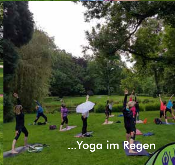
...Yoga im Regen